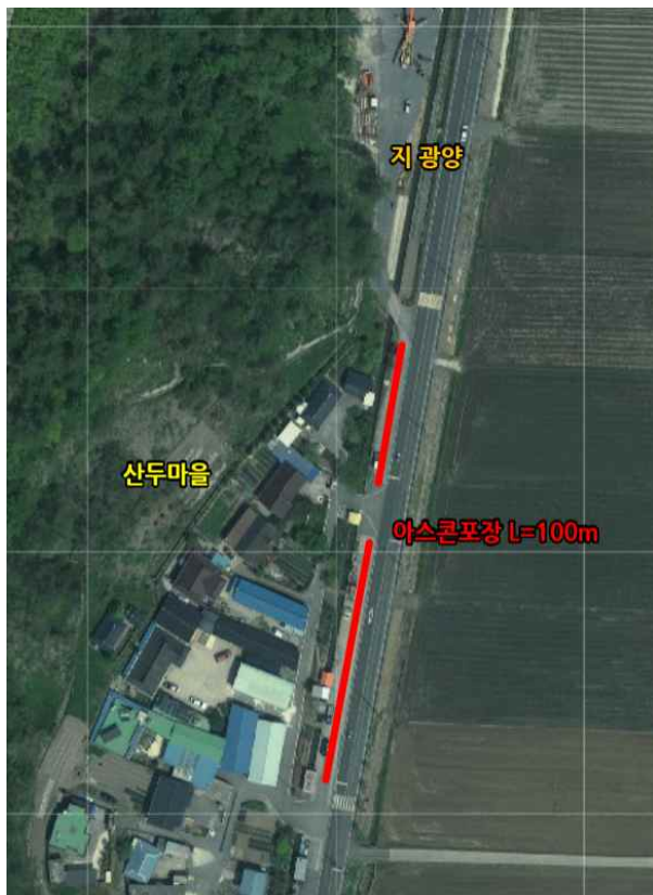
위치도 및 현장사진