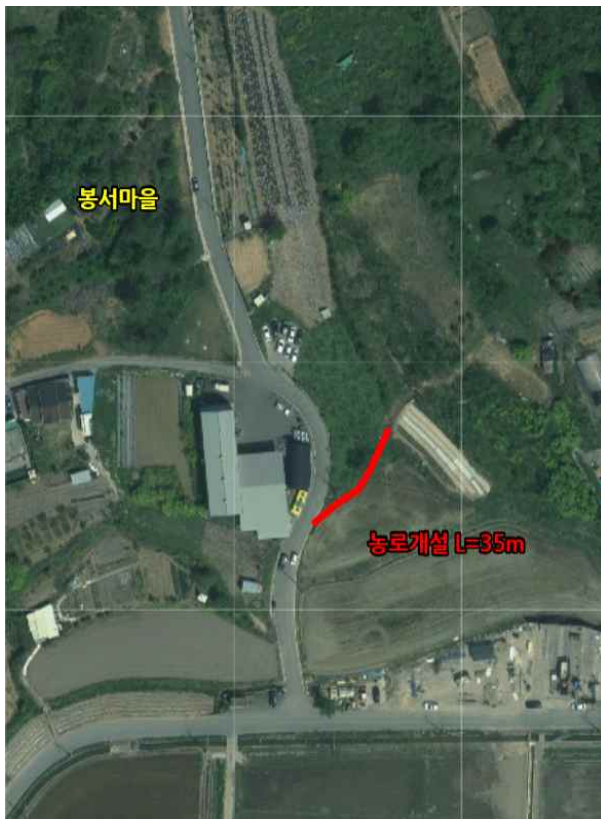
위치도 및 현장사진