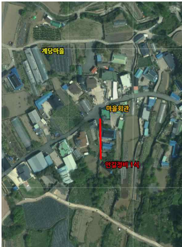
위치도 및 현장사진