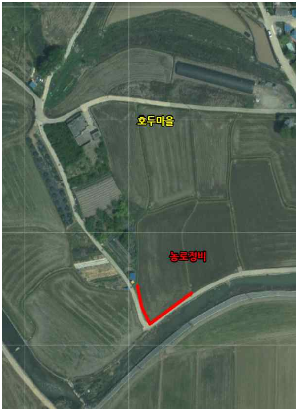
위치도 및 현장사진