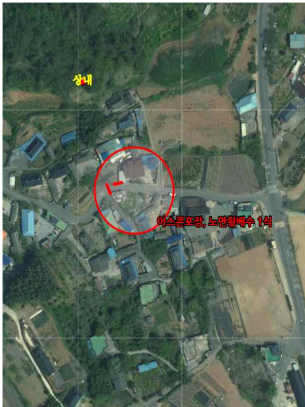
위치도 및 현장사진