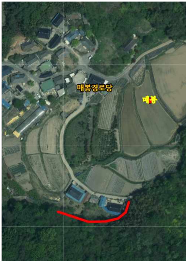
위치도 및 현장사진