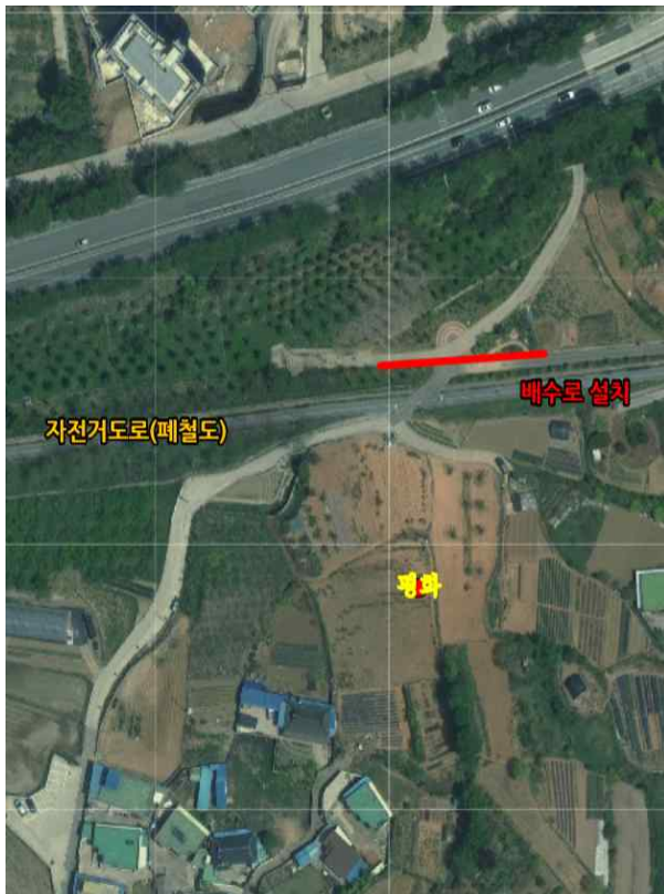
위치도 및 현장사진