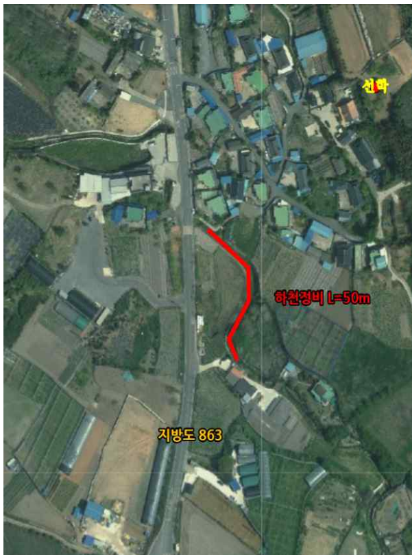
위치도 및 현장사진