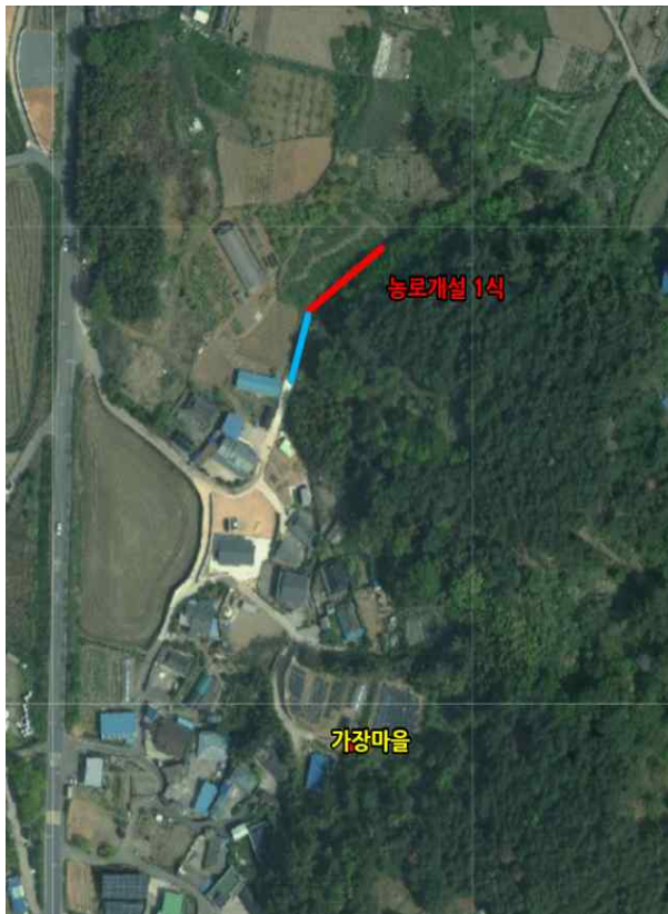
위치도 및 현장사진