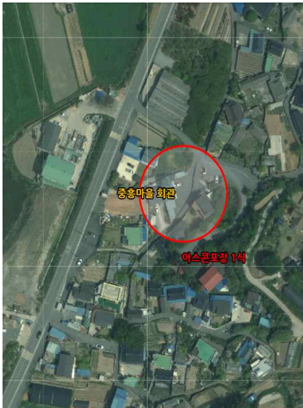
위치도 및 현장사진