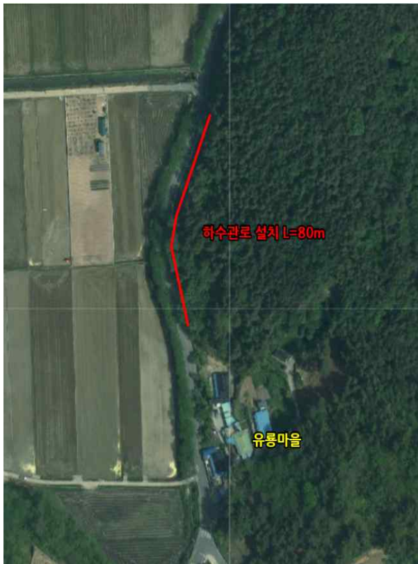
위치도 및 현장사진