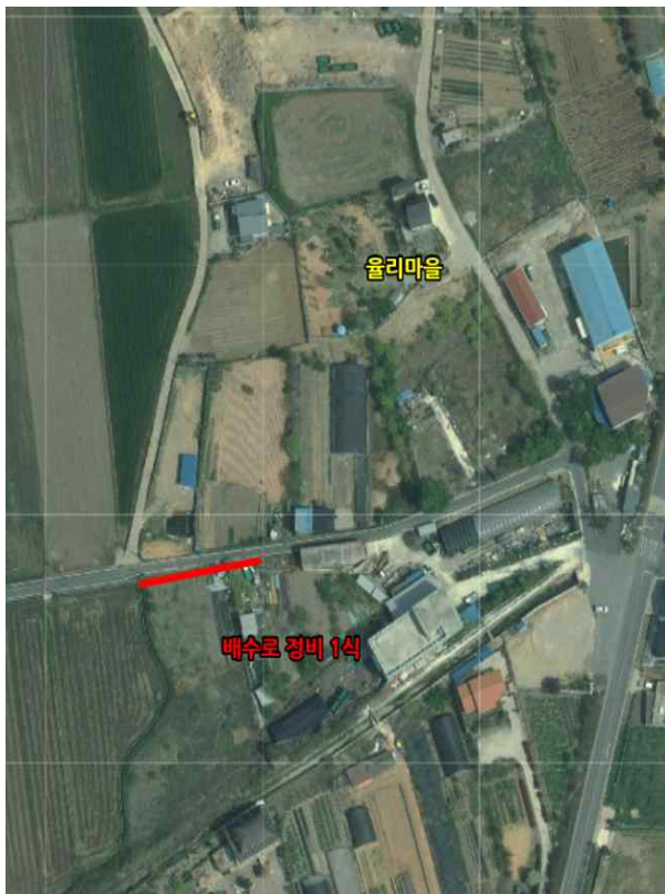
위치도 및 현장사진