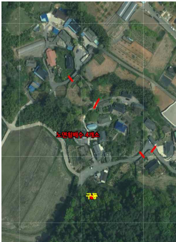
위치도 및 현장사진