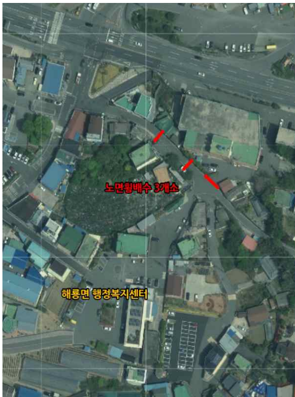
위치도 및 현장사진