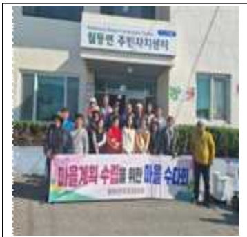
마을계획단 구성 주민제안서 접수