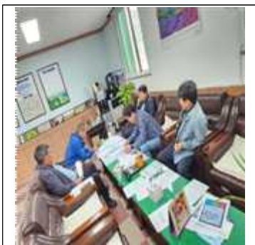
의제 검토 및 총회 안전상정