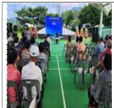
의견수렴 및 주민총회