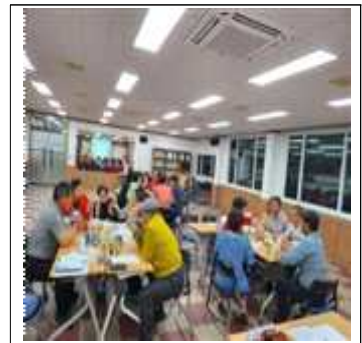
분과 워크숍 마을의제 발굴