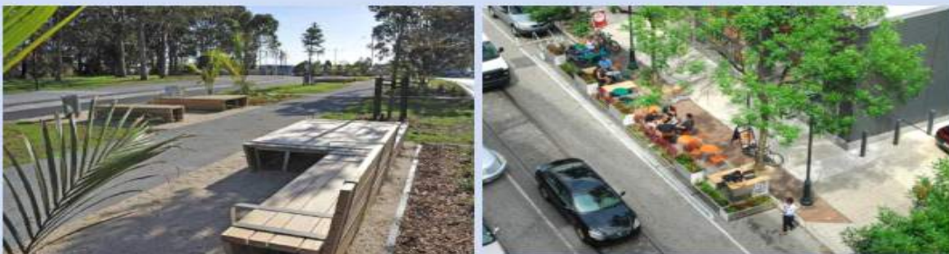
<도로다이어트로 조성된 녹지 및 휴게공간>

보행 및 친환경 교통수단 이용환경 개선과 녹지, 휴게공간 조성으로 거주민의 만족도에 대한 긍정적인 영향 미침