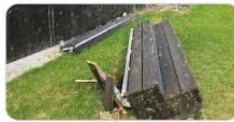
축제장 시설 파손