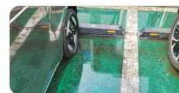
충전구역 위험요소(침수 우려 등)