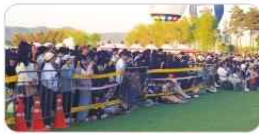
인파 밀집 우려