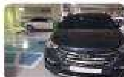
1면 주차 방해