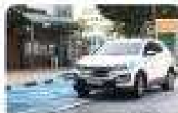
2면 주차 방해