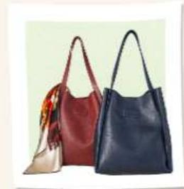
가죽공예 등 전시