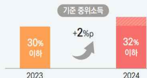
2023~2024년 생계급여 지원기준액