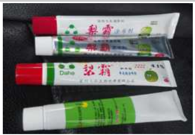
지베렐린 도포제(이패, 이왕, 부사산)