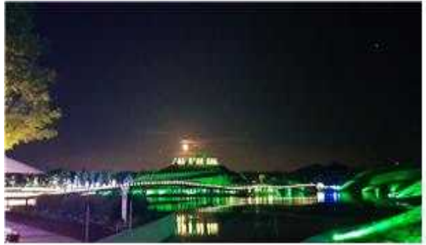
국가정원 봉화언덕 조명