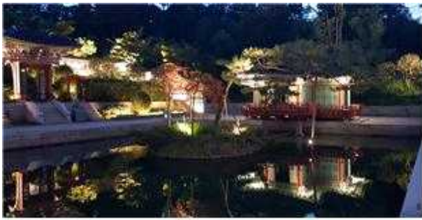
국가정원 연못 조명