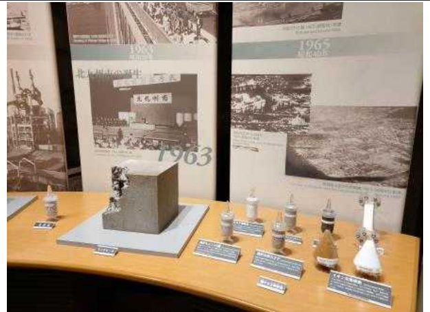
환경박물관 내 환경복원사례 전시