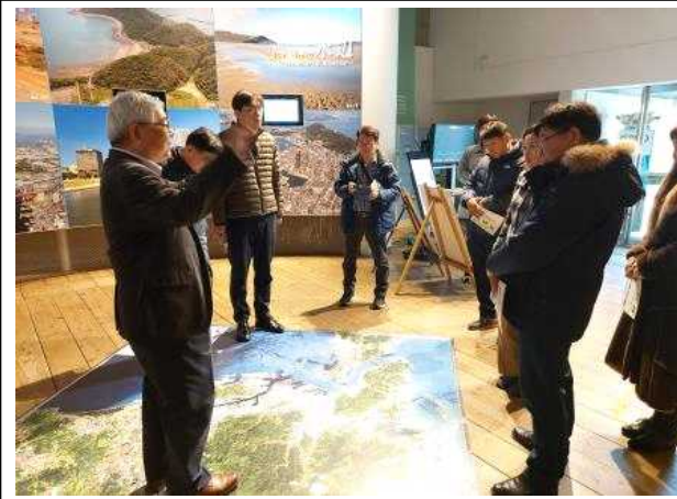
환경 박물관장 설명