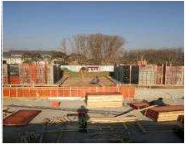
성각석 기초 폼 작업 중