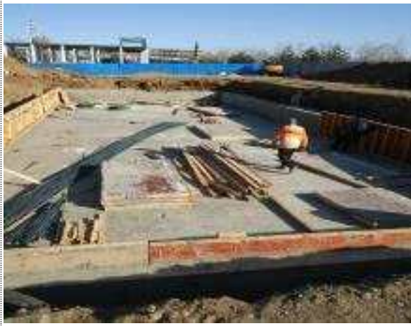
연지 포설 완료