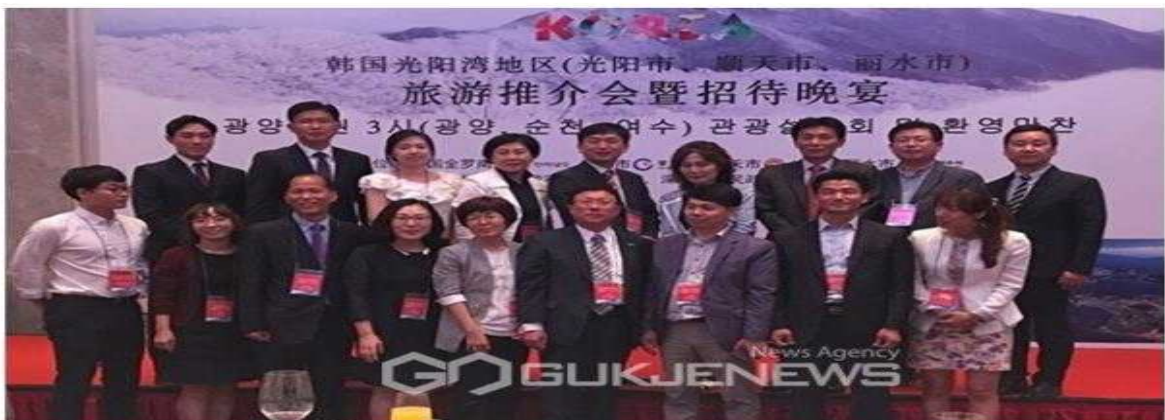
▲ 광양만권 3시(광양,여수,순천)가 중국 선전시에서 관광업무 협약 24건을 체결했다.

(광양=국제뉴스) 김대석 기자 = 광양시가 8일 중국 선전시에서 개최한 광양만권 관광설명회에서 관광업무 협약 24건을 체결하는 성과를 거뒀다.