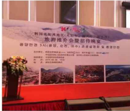
中国·深圳·东海朗廷酒店