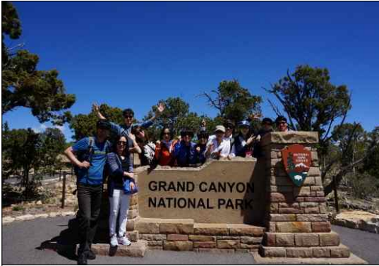
< 그랜드 캐년 >