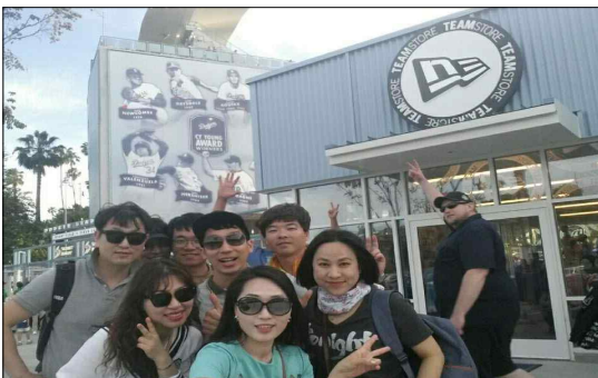
< 다저스 스타디움 >