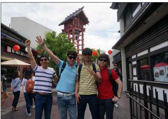
< 리틀도쿄타운 >