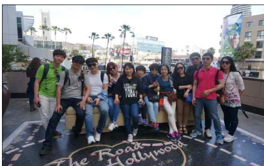
< 할리우드거리 >