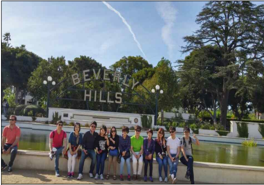
< 비버리힐스&로데오거리 >