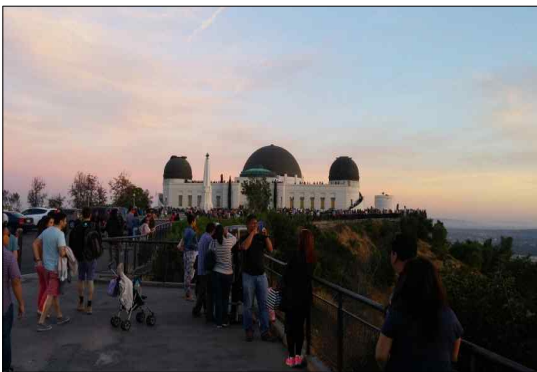
< 그리피스 천문대 >