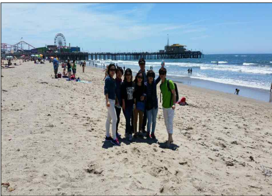
< 산타모니카 해변 >