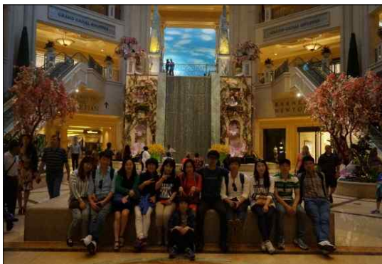
< 라스베이거스 호텔탐방 >