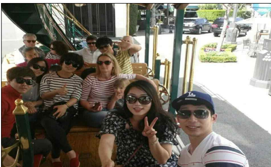
< 파머스마켓&그로브몰 >